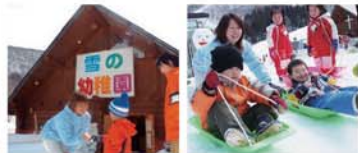
※各施設の営業日、料金等の詳細についてはホームページをご覧ください。

「まだスキーやボードのデビューはできないけど、雪遊びの楽しさを教えたい!」そんな声にお応えした雪遊び教室。雪遊びをしながら、雪の楽しさが学べる託児施設です。(室内託児室も完備)