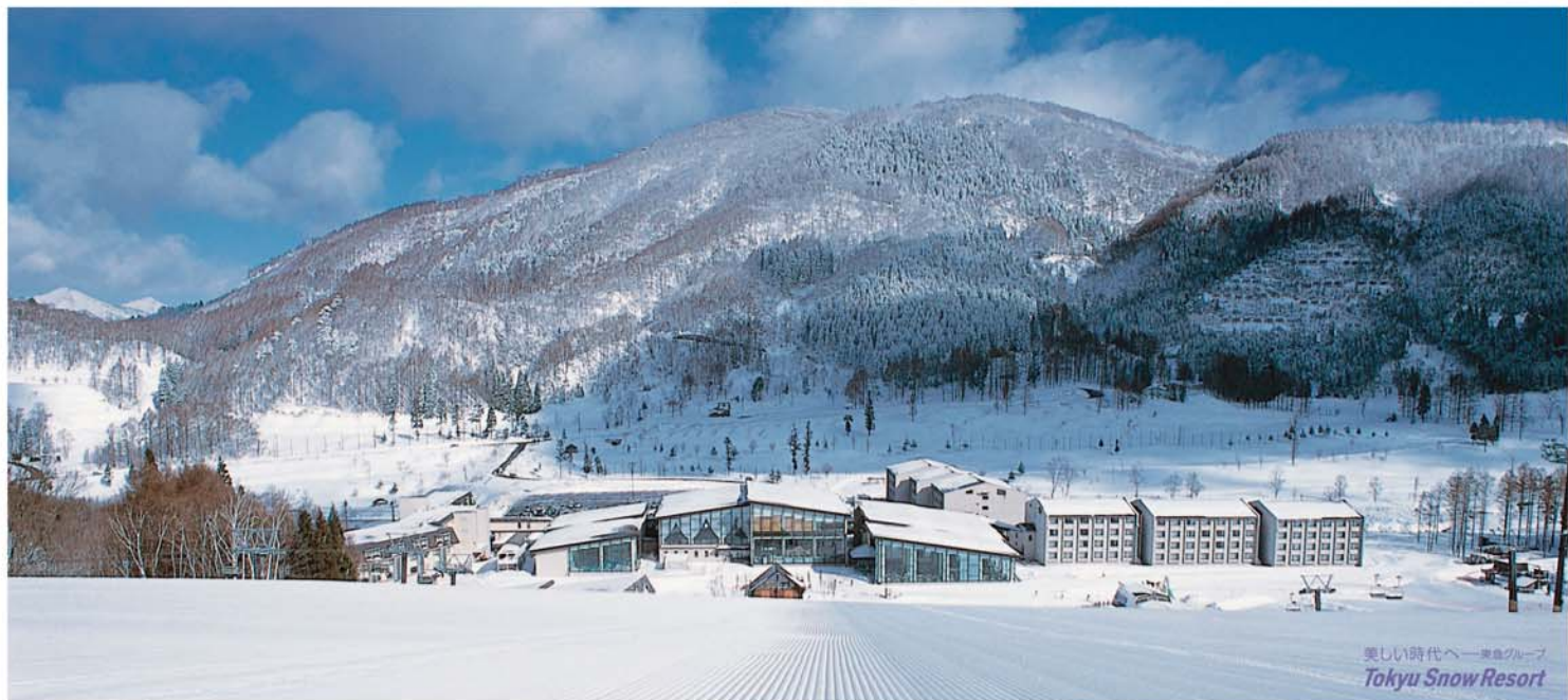
美しい時代へー東急グループ Tokyu Snow Resort