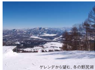
ゲレンデから望む、冬の野尻湖