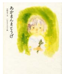
「あかまんとうげ」(童心社) 岩崎京子・文 いわさきちひろ・画

松谷みよ子 「モモちゃん」『アカネちゃん』『龍の子太郎』など赤ちゃんから熟年まで多くの読者を魅了する松谷みよ子さんの常設展示室。